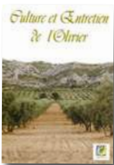
Culture et Entretien de l'Olivier