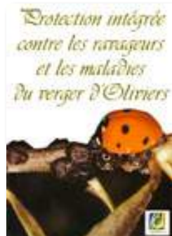
Protection intégrée contre les ravageurs et les maladies du verger d'Oliviers